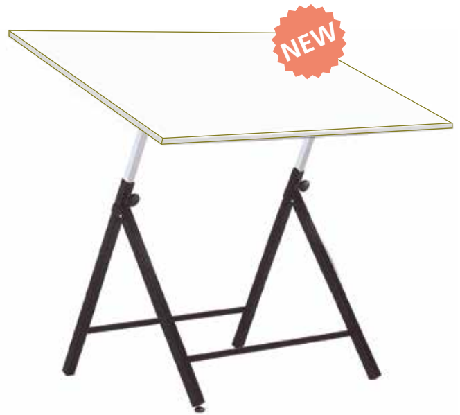
Table à dessin pour étudiant, structure métal conçue pour travailler avec des plateaux et des appareils à dessins de petites dimensions. Le réglage de la table se fait manuellement. Dispositif de mise à niveau. Montage facile. N'inclut pas le plateau.

Tableros opcionales Optional boards Verwendbare Plattengrößen Plateaux en option